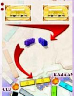
Voorbeeld 1 Om deze route te verbinden heeft de speler twee gele wagonkaarten nodig.

Indien nodig mag de speler 3 kaarten inleveren voor één locomotiefkaart.