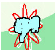
verlies 1 populariteitspunt