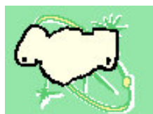
trek een BELOFTE kaart