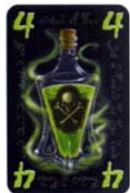
8 gifkaarten met de waarde 4