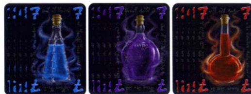
telkens 14 toverdrankkaarten in drie kleuren, per kleur twee kaarten met de waarde 4 en telkens drie kaarten met de waardes 1, 2, 5 en 7