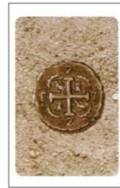
de achterkant van de kaart