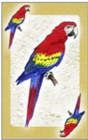
de vrijbouterkaart met gouden rand