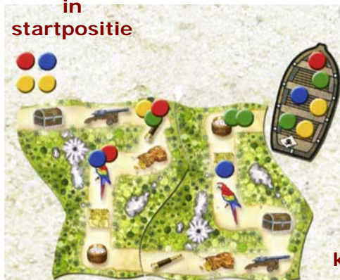
eerste en kleinste eiland