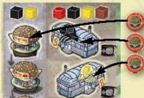
De startpositie van de Hamburgerspeler

Voorbeeld: Als de hamburgerspeler de zwarte blokjes in zijn persoonlijke zone plaatst, kan de pizzaspeler bij zijn eerste keuze geen zwart blokje nemen, hij kan dit wel in de volgende keuzeronde(s).